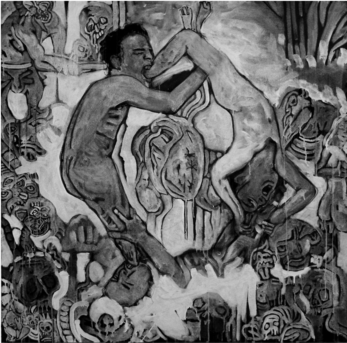
Uroboros / 2011 / Tomáš Petřík / Akryl na sololitu / 120 x 120 cm