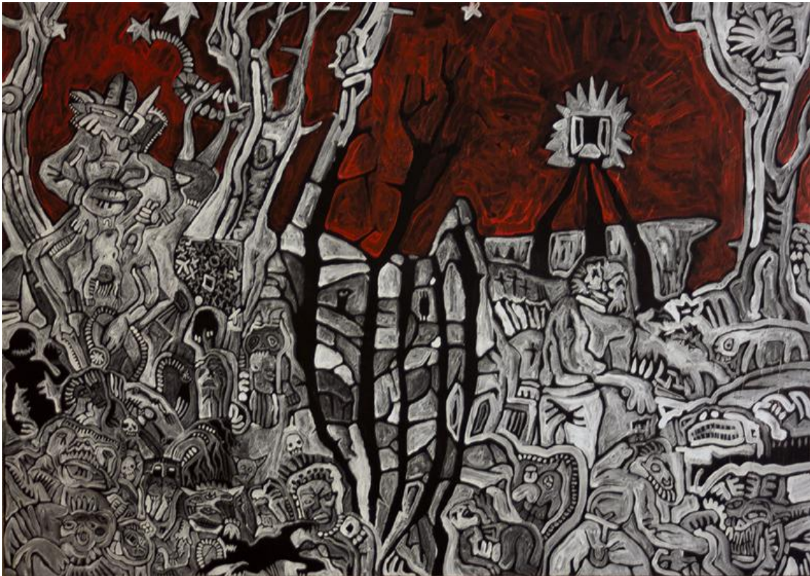
Labyrint světa / 2011 / Tomáš Petřík / Akryl na kartonu / 100 x 70 cm