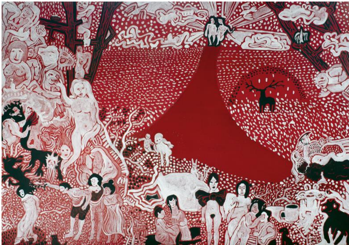
Ráj srdce / 2011 / Tomáš Petřík / Akryl na plátně / 100 x 70 cm